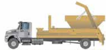
Transporte de Entulho