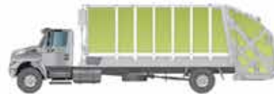
Coleta de Lixo