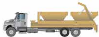
Transporte de Entulho