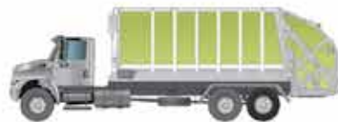
Coleta de Lixo